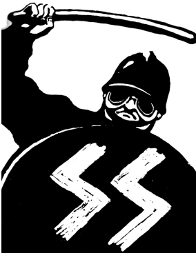
bonjour voisin! - Hola vecino Michel Quarez, 1994

El trabajo práctico se desarrollará en 9 (nueve) clases.